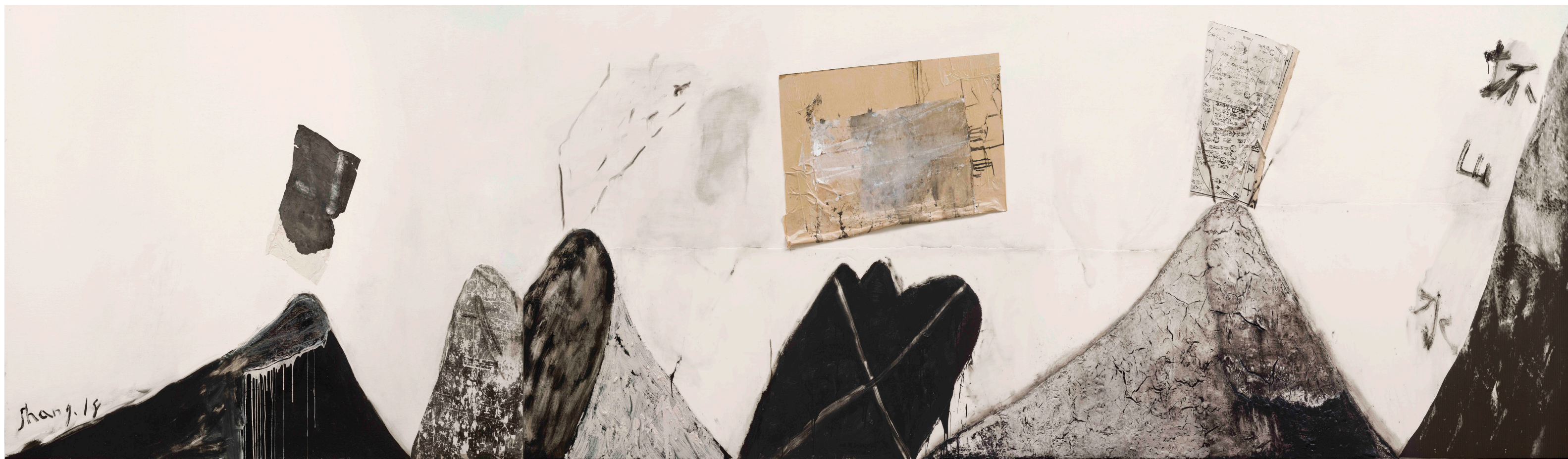
《坏山水 NO.3》布面综合材料 168 x 777cm 尚扬作