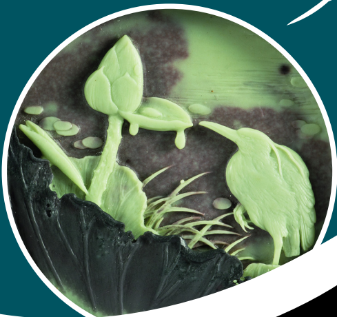
《白露》(局部) 陈礼忠作