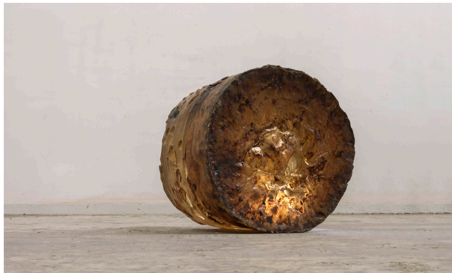
《白内障-未知物》树脂 57x57x49cm 尚扬作

为此，尚扬一方面将它们直接展示到画布上《白内障》，另一方面，他将这些乙烯制品处理成类似画布但有厚度的平面《白内障切片》，在它干燥之后使之保持一个固定的形状并能悬挂。不仅如此，尚扬在这些厚重的乙烯制品中包裹了各种各样的零碎杂物，人们并不清晰这些杂质为何？它们隐隐约约，斑斑点点，凹凸不平，构筑了这个化工“画面”景观：这个景观有时候看起来像剩余垃圾物那样，肮脏不堪；但有时候看起来却又有一种特殊的凌乱之美：它们色彩朦胧，有物质零星点缀，像一张随机而成的抽象画一样，似乎是一种特殊的风景，这些作品的效果，既和谐也混乱；既优美也肮脏，这不是今天的人造地表景观的如实隐喻吗？我们有各种各样可见的“风景”，但这可见的风景在其中包裹着某种隐秘的坏核。这些可见的风景有时候有一种人工的精致，但是，它难道不也是灾异的预言？那些奇怪的构图、奇诡的凹凸、奇异的点缀，不是一种灾异图式？灾异往往和优美携手同行，在优美之中包含着灾异。同样，这些奇怪的不平展的构图是抽象画，但不也是对地球的地理测绘吗？不是地球的一个俯视图吗？同样，这个截面这个切片有厚度，它们包裹着某些杂质，它们有浅表的深度，这难道不像是地球表面上的薄薄一层吗？而人类对地球的征用和折磨不正是在这虽然浅表但依然有厚度的层面进行的吗？在尚扬的《白内障切片》这里，我们看到了抽象风景和地理测绘的融合，优美和灾异的融合，深度和平面的融合，以及最根本的，有限性和无限性的融合。这些作品，这些切片，它们是如此的有限，但是，它们难道不也是无限地球的预示吗？不是对无限地球的灾异性预示吗？