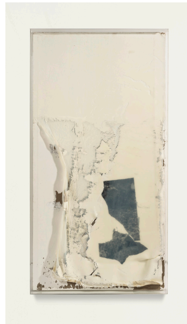
《白内障 NO.6》布面综合材料 171x88x9.5cm 尚扬作

如今，董其昌式的山水杳无踪迹，这令尚扬的作品越来越出现一种触目惊心的粗犷。在先前的作品中，对完整的山水还有依恋之感，甚至还会将自然山水作为要素以各种方式引入作品中，人们在那里看到了一个完整山水的苦苦折磨，它们被各种外物所刺伤，它们在痛苦地呻吟，它们的呻吟似乎在召唤挽救。但是现在，山水的总体性彻底消失，偶尔在画面上出现了山水，也是一种彻底的败坏，这是无可挽回的颓败图景。因此，尚扬干脆就将他的新作品命名为“坏山水”。尚扬似乎要将画面不顾一切地毁掉，他的画面仿佛就是山水，他奋力地制作出山水，但也奋力地毁灭这山水。他拿着大刷子在这些山水上疾戳，他在山水周围愤怒地书写指控；他甚至在整张大画上直截了当地宣告了山水和自然的decay（腐烂）；这像是在判决，在宣示，在抗议。如果说，尚扬先前的绘画既有冷静的反思（黄河船夫），有理性的质疑（大风景），有历史的感伤（董其昌计划），有具体的哀悼（吴门楚语），如果说，所有这些都对自然的复建尚存希望的话，那么现在，尚扬似乎已经不再抱任何期待，他不仅在毁坏画布上的山水，还在毁坏画布本身，他干脆自己动手，自己来摧毁。我们看到了他的愤怒，我们看到他作品中的撕裂，破败和衰竭的图式，画布无力承载山水，画布本身已经凋零，画框已经摇摇欲坠，因为目光之中已无风景，唯有剩余的撕裂残片。失去的似乎已经不可能再回来了，除了抗议之外还有何办法？